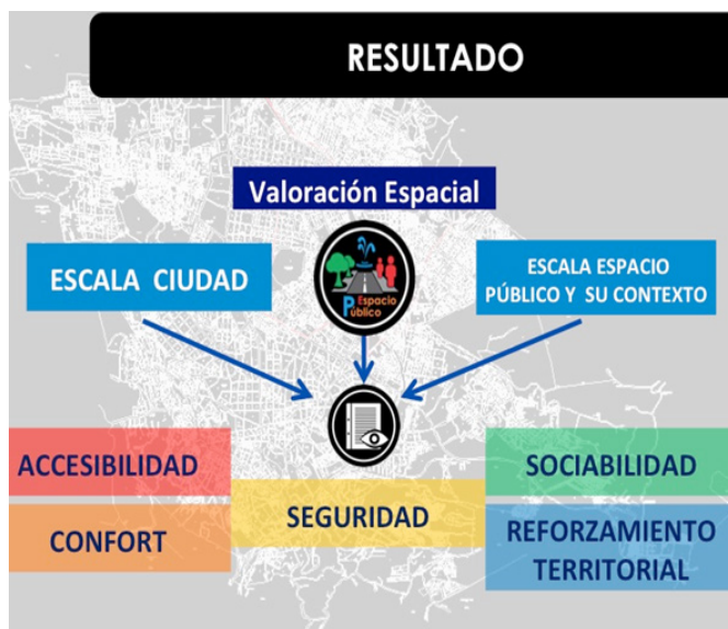
Figura 4. Simbología de los espacios públicos en la plataforma digital del observatorio del espacio público..

Con el trabajo realizado se han obtenido resultados preliminares sobre una valoración espacial sobre cómo funcionan los espacios públicos a través de las categorías de análisis mencionadas anteriormente. El análisis se realizó a nivel micro, es decir a la escala espacio público y su contexto, por ejemplo una calle o un parque. También de manera se realiza un análisis a nivel ciudad, esto nos da una valoración sobre cómo se comportan los distintos fenómenos observados en el conjunto de los espacios públicos de la ciudad. De este modo, conocemos como los espacios están funcionando en términos de accesibilidad, confort, seguridad, sociabilidad y reforzamiento territorial (apropiación y personalización) a nivel micro y macro (ver figura 4). La plataforma digital en línea del observatorio coadyuvará a difundir estos resultados con el fin de que sea una herramienta de información para la academia e idealmente para la autoridad local para el establecimiento de estrategias de acción encaminadas a un manejo eficiente, intervenciones de mejoramiento y/o estrategias de mantenimiento más acertadas y en total sintonía con las necesidades sociales y espaciales, ya que así conocemos más a fondo cómo funciona el espacio público en sitios específicos de la ciudad.