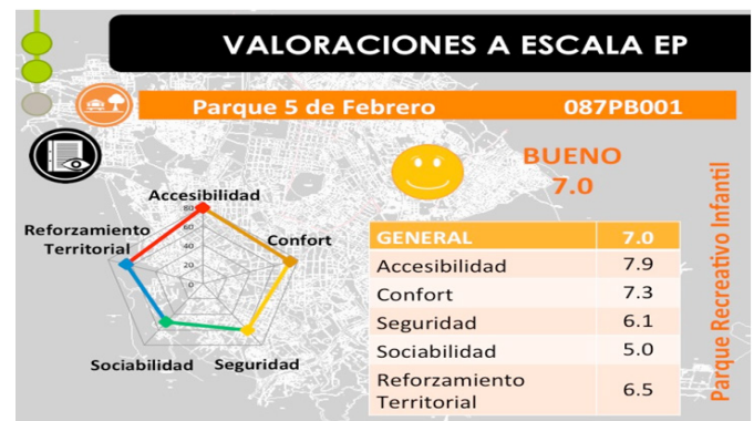
Figura 5. Valoraciones a la escala “micro” espacio público: calles, parques, espacios deportivos, etc.