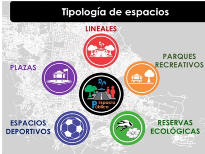
Figura 1. Simbología de los espacios públicos en la plataforma digital del observatorio del espacio público.

arquitectónico y otro socio-funcional. Siendo en el primero donde se analizan las características físicas, condiciones del espacio y su entorno, funcionalidad, distribución espacial y de equipamiento; y la segunda se encarga de analizar la percepción social del espacio, el papel que juega en su contexto total e inmediato, así como la aceptación que tiene el usuario de su espacio, y como es usado y apropiado. Este segundo ámbito es para concluir con el diagnóstico sobre cómo los espacios públicos son aceptados por la ciudadanía y así poder concluir sobre el estado de dichos espacios, de modo que se puedan crear premisas de diseño para la futura creación y/o intervención de los espacios públicos.