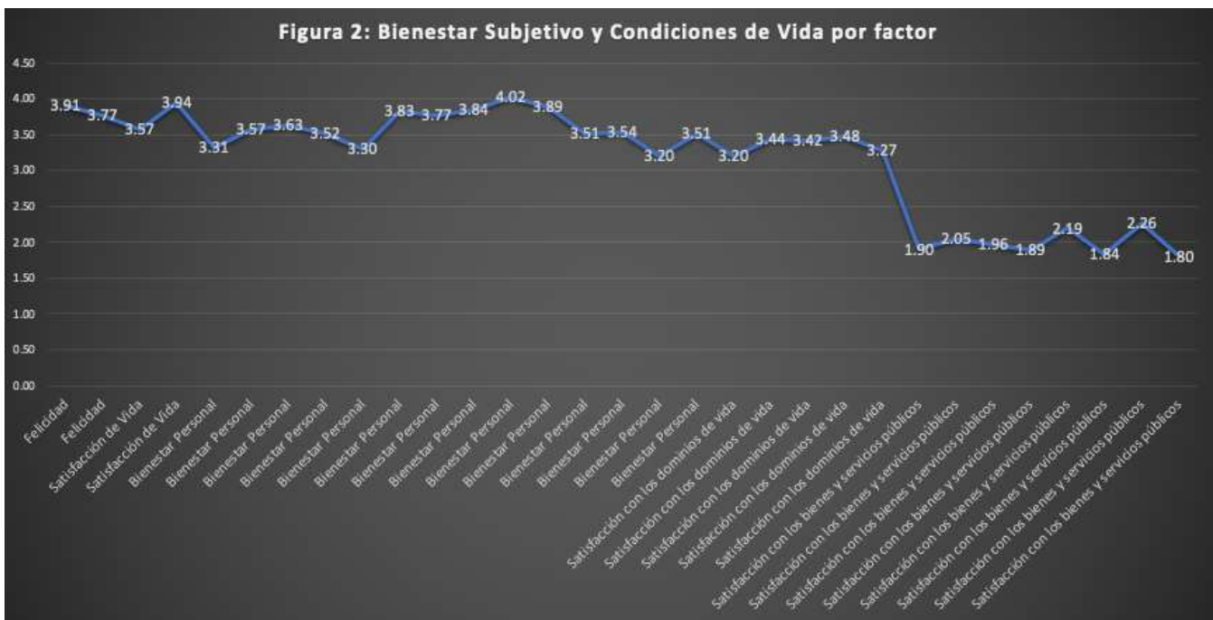
Figura 2: Bienestar Subjetivo y Condiciones de Vida por factor.

Como se puede apreciar en la Figura 2, los resultados relacionados con las esferas personales (Felicidad y Satisfacción con la vida) son los que reciben una valoración más alta por parte de los encuestados.