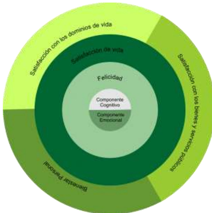
Figura 1: Componentes teóricos del Bienestar Subjetivo. Fuente: Beltrán Guerra, L.F. (2018). La psicología social en la medición del bienestar subjetivo para gestionar el desarrollo de las sociedades. Psicología Social y Cultura. México: Universidad Veracruzana