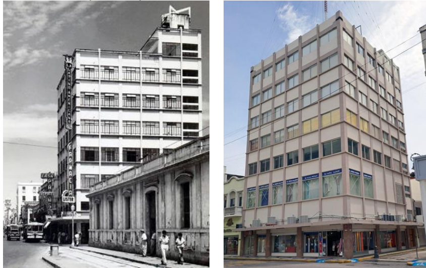
Figura 2 Edificio Pazos (ca. 1940), con alteraciones menores

Nota: [Izq.] Edificio Pazos visto desde el parque Zamora. ca.1950. recuperado de https://tinyurl.com/2v2hjdhn . [Der.] Edificio Edificio Pazos visto desde la Avenida Independencia. 2024. Fotografía: Marco Montiel Zacarías.